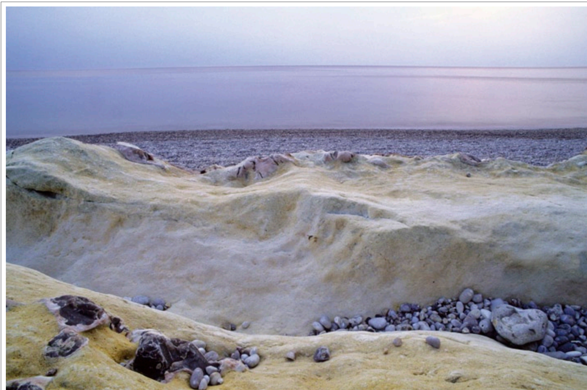
Plage rose Normandie