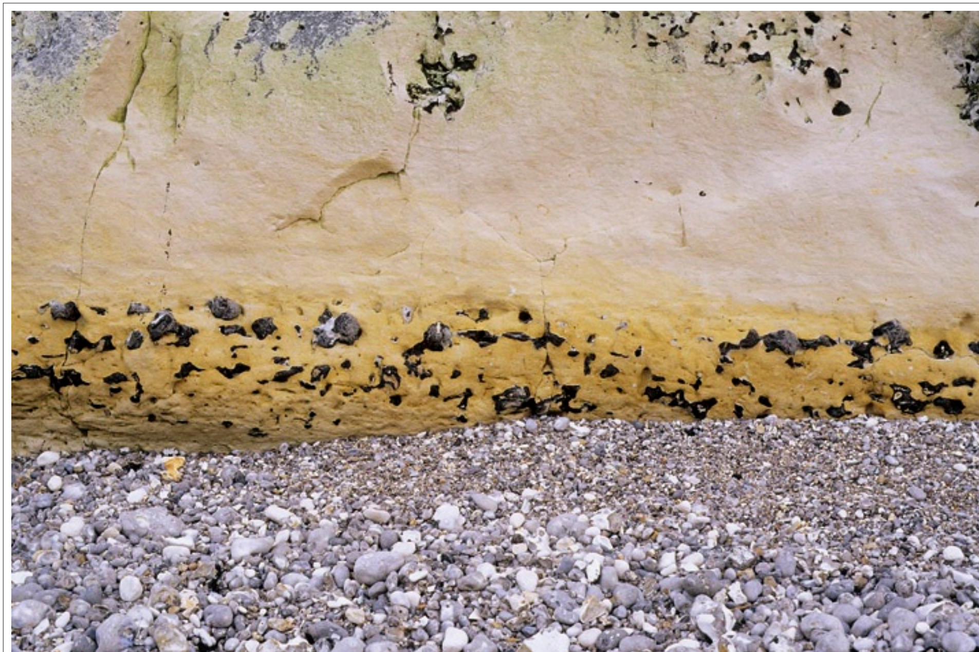
Grève de galets et falaise Normandie