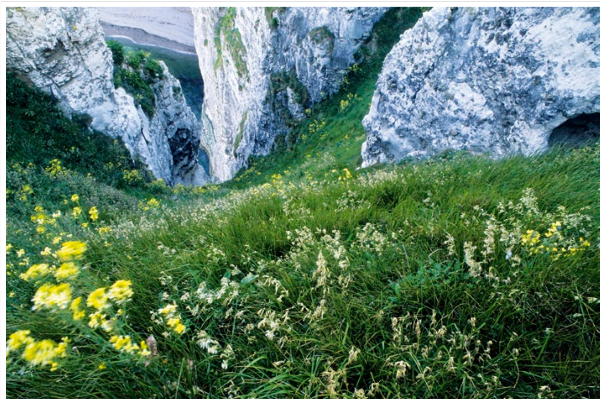
Falaises dans le vent Normandie