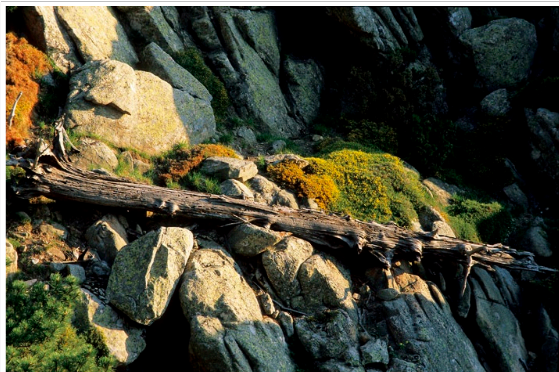
Lumière matinale sur un arbre mort Corse